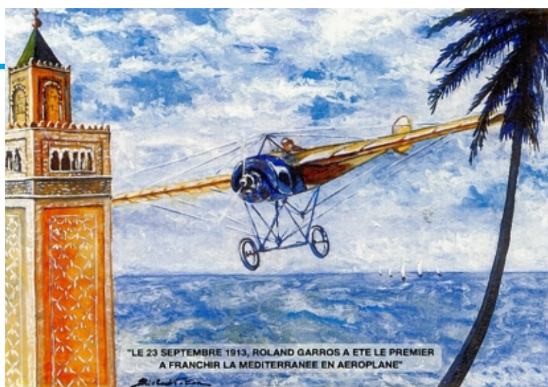
L'exploit de 1913 commémoré par Vouziers.

« Il doit me rester deux heures et demi d'essence. Atterrir, c'était mutiler cette traversée, abîmer un rêve. Je n'oublierai jamais ce moment d'hésitation. Une force mystérieuse plus forte que ma raison et ma volonté m'entraîna vers la mer ». Pour rejoindre la côte tunisienne, il lui faut économiser du carburant aussi monte-t-il à 2.500 puis 3.000 mètres. Son appareil est quelquefois à la limite du décrochage. Bientôt, il ne lui reste plus que dix litres d'essence et atteindre Tunis se révèle impossible en revanche aidé par un balisage de feu allumé par des paysans. Il se pose à quelques kilomètres de Protville entre Bizerte et Tunis. Il a réussi sa traversée. Le lendemain, il atterrit à 7 h 15 sur le champ de course de Kassar-Saïd.