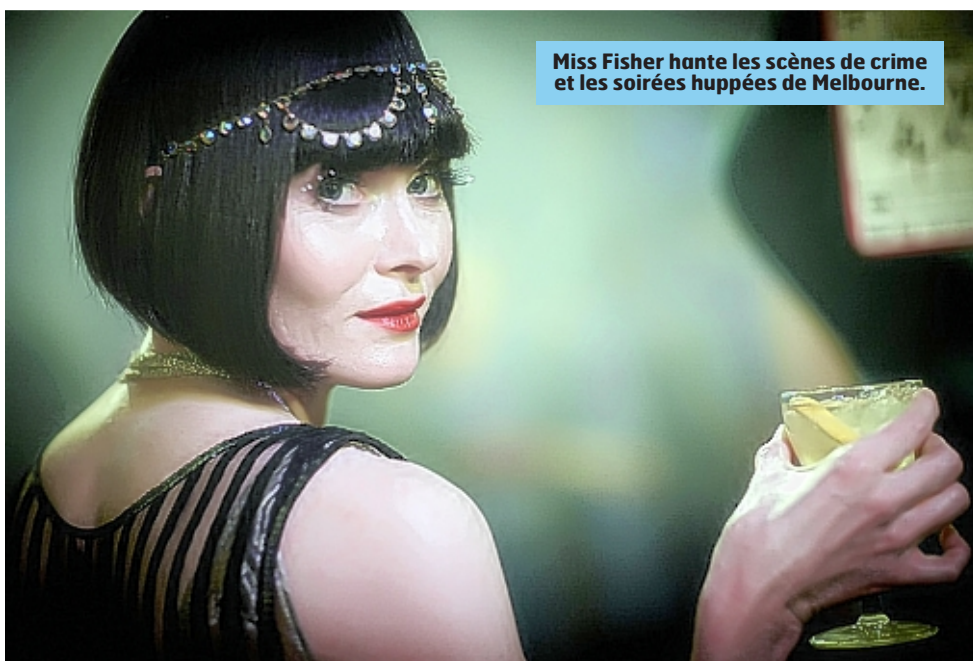
Miss Fisher hante les scènes de crime et les soirées huppées de Melbourne.

« DVD-Guides - Malaisie, l'Asie en réserve ». Documentaire français (2013 - 52 minutes). Media9. 15 euros. Infos sur www.decouvrir-le-monde.com