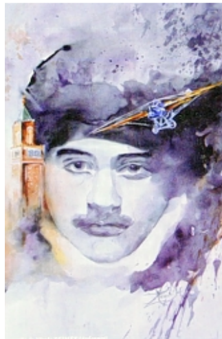
L'une des quatre cartes postales éditées à Vouziers.